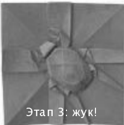
Этап 3: жук!