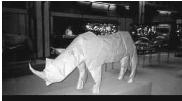
Носорог, сложенный Жуазелом на выставке в Лувре, поверг в шоковое состояние даже бывалых оригамистов. Никогда прежде бумажные модели не были такими реалистичными!

Джона Монтролла? Носи? Зигзагообразные ленты го-хэй в синтоистских храмах? Мехо и охо? Вряд ли мы когда-нибудь это узнаем. Факт: на определённом этапе мастера бумажного складывания стали стремиться к большей выразительности форм, к более детальному воссозданию в бумаге оригинальных объектов.