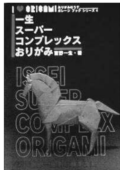
"Issei Super Complex Origami" – библия для поклонников комплексного складывания