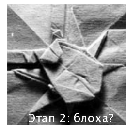
Этап 2: блоха?

Не отставая от моих "усатых товарищей", время промелькнуло незаметно. Завтра начинается 5-ая Всероссийская Конференция! Надо срочно довести до ума некогда начатое! Тогда-то и появился вариант "жук-барельеф", на котором я поставил точку, сложив модель в виде крышки на коробочку.