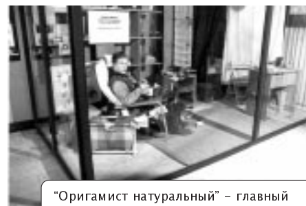
"Оригамист натуральный" – главный "экспонат" второй международной выставки оригами (май, 2001)

П р и определённых обстоятельствах этот весьма перспективный молодой человек (Пашке 17 лет) может стать российским Питером Будаи (инициалы совпадают!), чего я ему от души желаю.